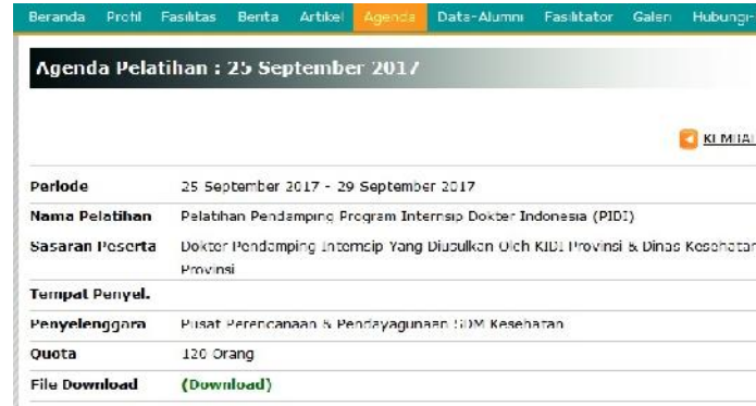
Mendownload File Kelengkapan