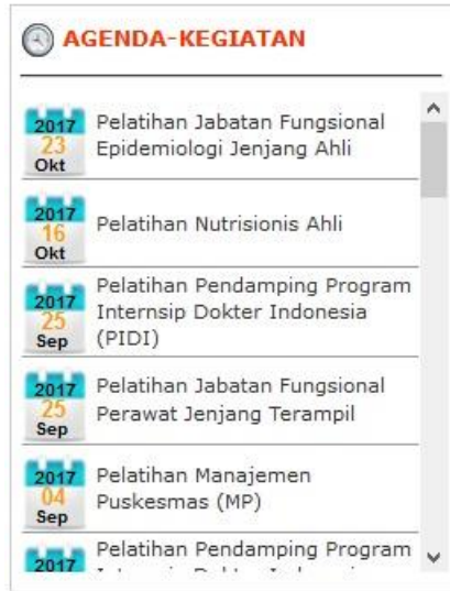
Memilih Jenis Pelatihan