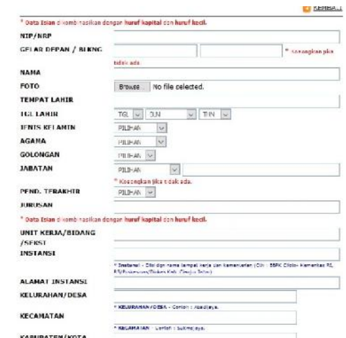
Input Data (File Kelengkapan Dikosongkan)